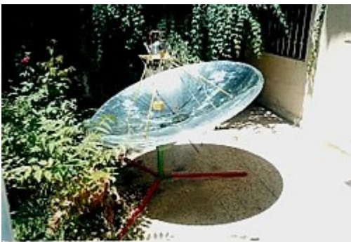
Mein syrischer Solarkocher

Gerade die besonders rückständigen Länder der 3. Welt sind teilweise mit einer sehr starken Sonneneinstrahlung ‚gesegnet‘, obwohl dies von ihnen oftmals gar nicht so empfunden wird. Da diese Länder häufig eine nur schwach entwickelte Infrastruktur besitzen liegt es nahe, hier mit einer gezielt angepaßten und dezentralen Sonnenenergienutzung vorzugehen. Denn diese erlaubt ein sehr breites und sehr unterschiedliches Anwendungsspektrum umzusetzen – angefangen von sehr einfachen Sonnenkollektoren und -pumpen bis hin zu Sonnenkochern, solaren Ziegelbrennereien usw.